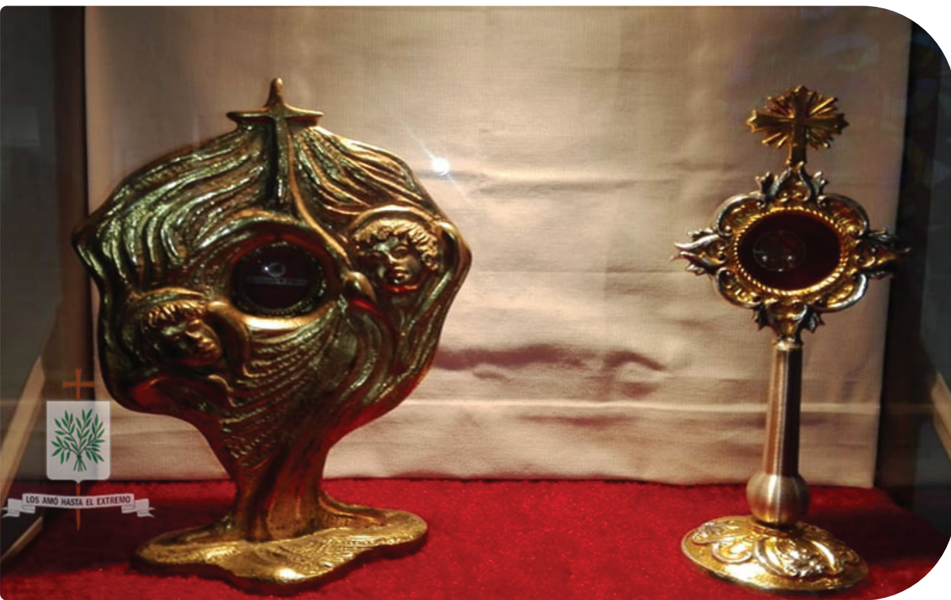
Reliquias de San Juan de Capistrano y San José Gabriel del Rosario Brochero.

Continuando, destacaba, “ habiendo tomado a Jesús como camino, como verdad y como las vidas del Santo Brochero y San Juan de Capistrano, para mí es un motivo de gratitud, de gran alegría y de confianza de saber que bajo el testimonio de ellos confío mi ministerio. Dando gracias por el sacerdocio y por este día, el cual recuerdo como decía el Santo Cura de Ars, <me postré consciente de mi nada y me levante con la certeza de ser sacerdote> ”